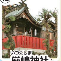
いづくしま 巖嶋神社