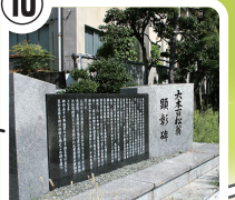
大本百松翁顕彰碑